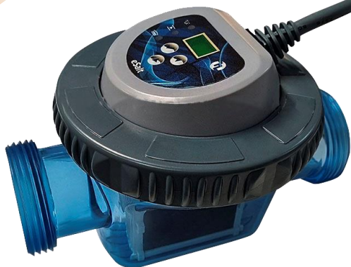
Комірка eSALT з інтерфейсом управління